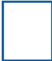
-- ว่าง -- นักวิชาการสารารณสุข ปก/ชก